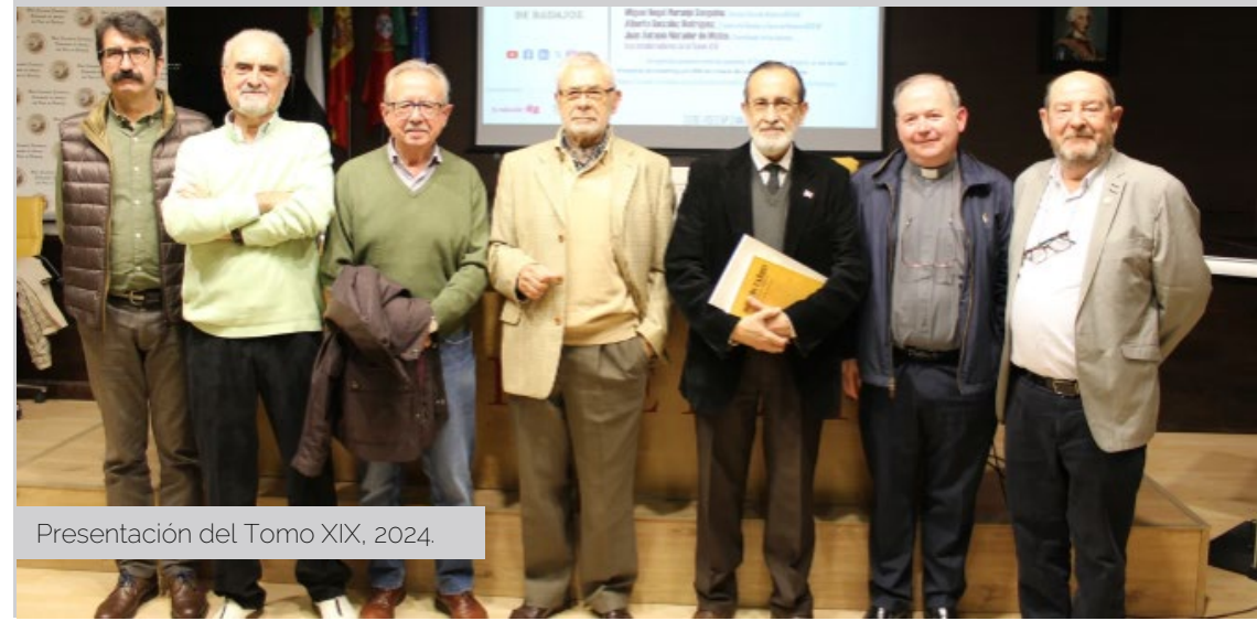
Presentación del Tomo XIX, 2024.

Realmente, la labor más ardua es conseguir sacar para adelante tomo a tomo esta Colección. La verdad es que no abundan los colaboradores; máxime, cuando los Apuntes... tienen una temática tan concreta como es la ciudad de Badajoz y sus relaciones con el resto del mundo.